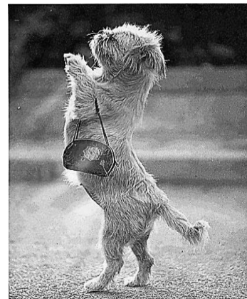
Glamour en un desfile mascotero

Glamour: atractivo o encanto especial que tiene una persona o una cosa, especialmente relacionado con el espectáculo o la moda.